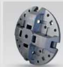
روتور ماسه ساز