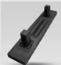
بیش از ۲۲ نوع چکش پارکر