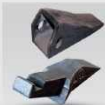
ناخن آلات راه سازی