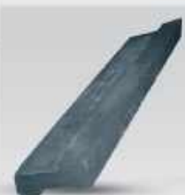
چکش بهرینگر HS 10