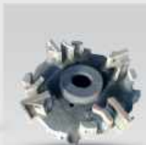
روتور میانی پارکر