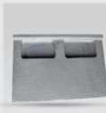
چکش کوبیت ۱۲۰