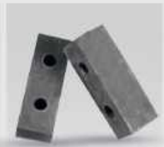
چکش دو سوراخ