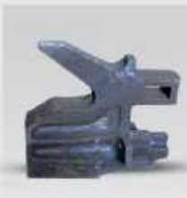
چکش ماسه ساز