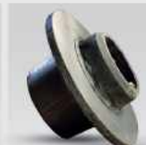
گلدانی سنگ شکن هیدروکن